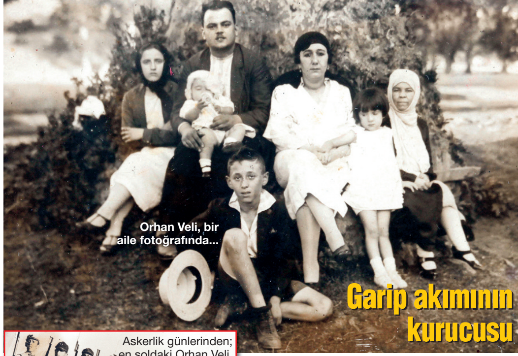
Orhan Veli, bir aile fotoğrafında...