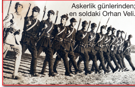
Askerlik günlerinden; en soldaki Orhan Veli.

13 Nisan 1914'te İstanbul Beykoz'da doğdu. Melih Cevdet ve Oktay Rifat ile birlikte yenilikçi Garip akımının kurucusudur. Türk şiirindeki eski yapıyı değiştirmeyi amaçlayan sokaktaki adamın söyleyişini şiir diline taşıdığı, 1940-1950 yılları arasında Cumhuriyet dönemi şiirinde büyük etki bıraktı. Şiirlerinin yanı sıra hikâye, deneme, makale ve çeviri alanında birçok eser verdi. 36 yaşında öldü.